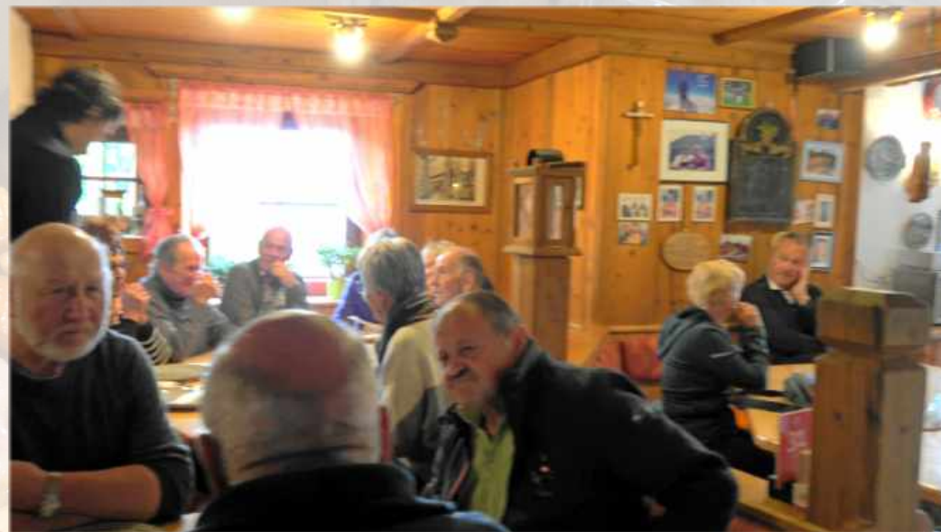
Mittagessen im Berggasthaus Grünbergalm