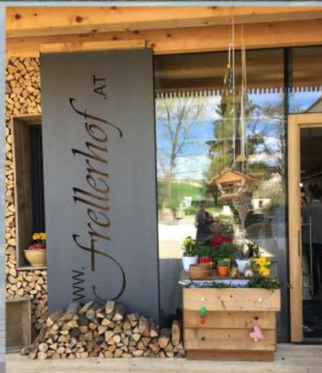
Abschlußeinkehr im Frellerhof - Mauthausen