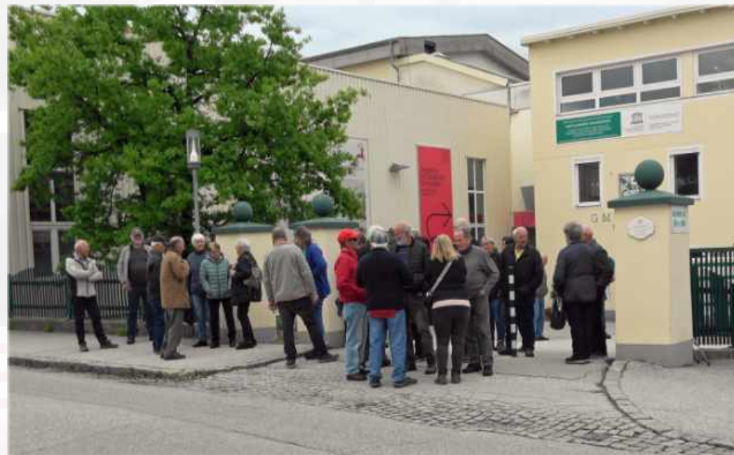
Fahrt zur Talstation Seilbahn Grünberg