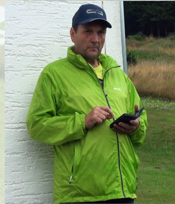
Mail an Petrus „Regen einstellen“