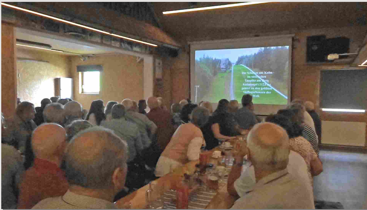
Nach dem Essen ein Video vom Ausflug Ausseerland