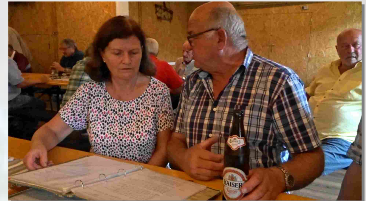
Mitsingen war erwünscht