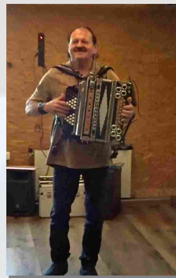
Bei zünftiger Musik mit unserem Vollblutmusikanten „Da Hase“ Verging dieser Nachmittag wie im Flug