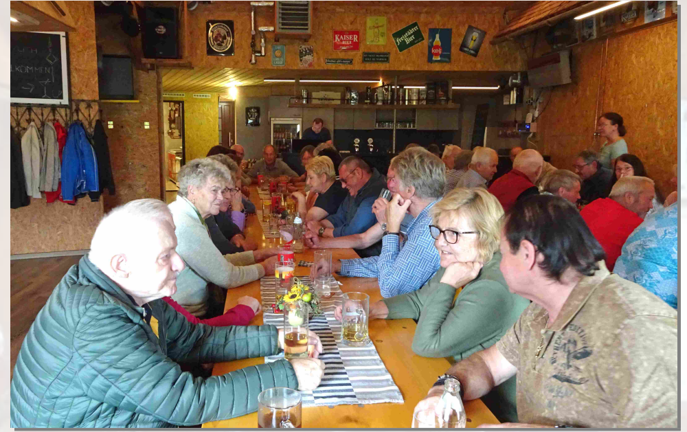
Zu unserem schon zur Tradition gewordenen Weißwurstessen in der Rostbar Schanz fanden sich heuer 55 Personen ein