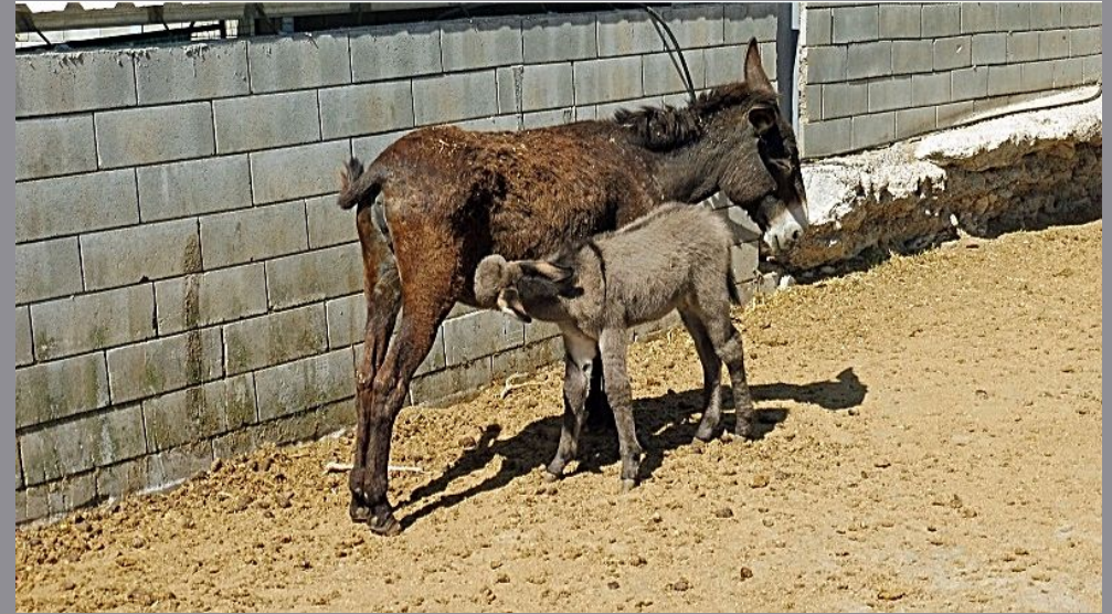
Auch ein Esel hält Siesta