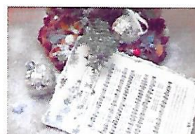
music-sheet-Bild von Desiré Dazzy K-e-k-t-e auf Pixabay

Information und Anmeldung: bei Herrn Gerhard Stock Tel.: 0677/62 43 78 68