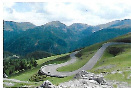
© Nockalm-Strasse Kärnten.AT - Bild von der_nies auf Pixabay

Achtung: Reisepass oder gültiger Personalausweis erforderlich.