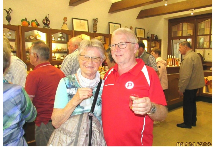
Schöne Frauen und Schnaps das gefällt unserem Vorsitzenden