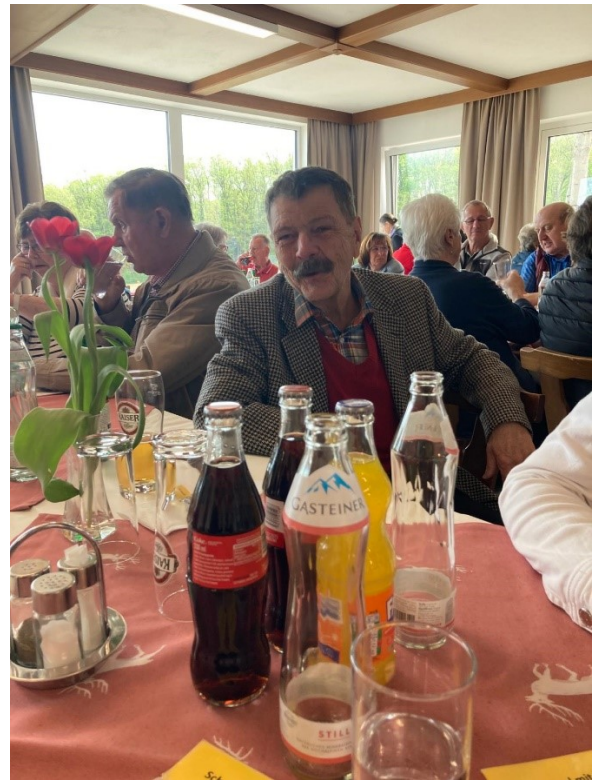
Nachmittag Besuch der Bailoni Schnapsfabrik