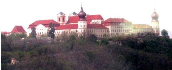
Stift Göttweig v. Osterhaus