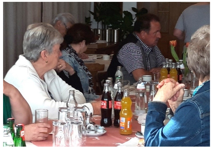
Angeregte Unterhaltung über die angebotenen Massagegeräte