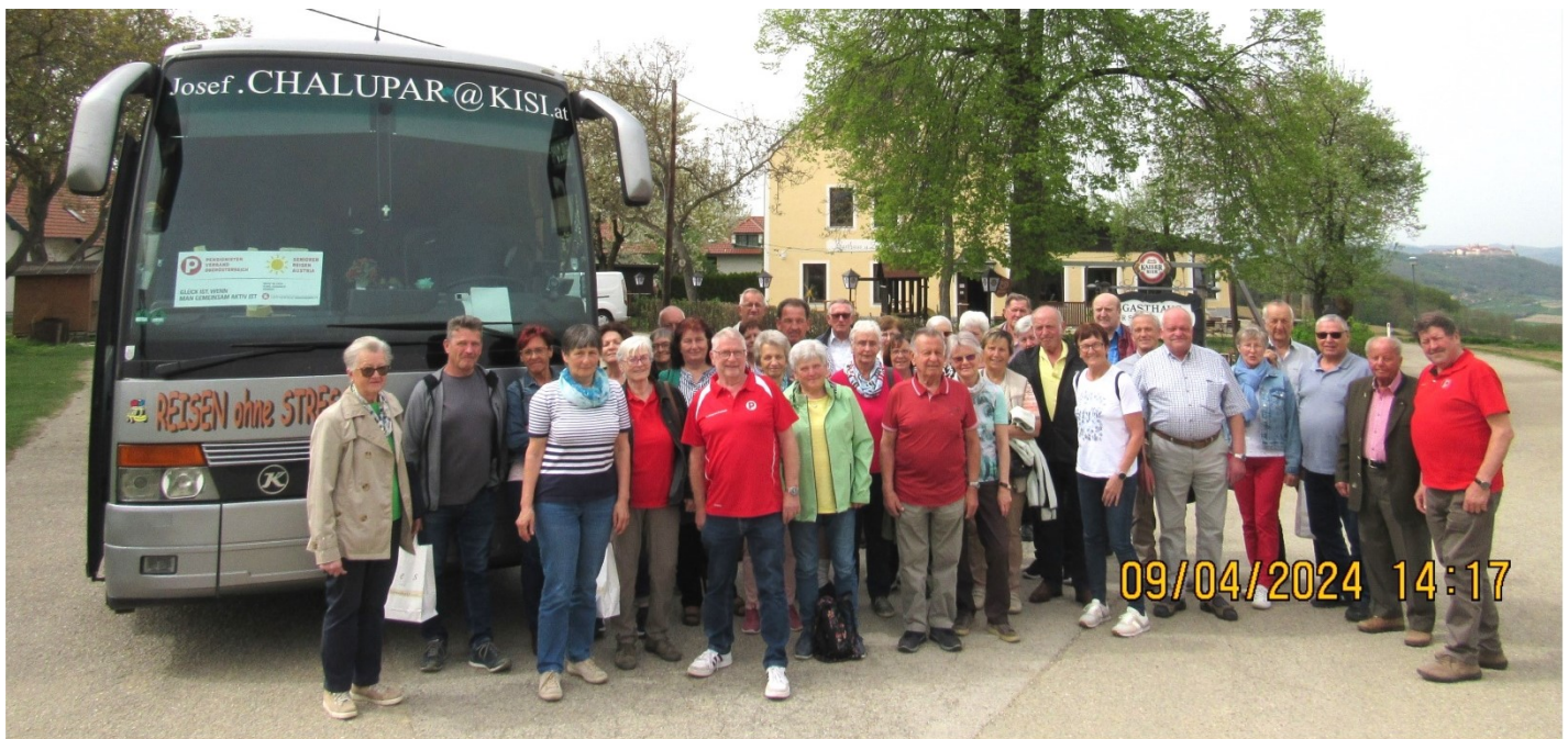
Windhaager Pensionisten*innen beim GH. Osterhaus in Maria Ellend

Um 6:15 ging's los. Abfahrt Bergstraße in Windhaag. Über Sandl Zwettl wo wir eine kleine Pause einlegten, ins Weinviertel nach Maria Ellend. Ein Unfall in Krems und der geschlossene Schranken zwangen uns zu einem Umweg. Wir kamen 20 min. später ins Gasthaus Osterhaus (Gasthaus zur schönen Aussicht) wo uns der Herr von Puntigamer Reisen schon sehnsüchtig erwartete. Nach einer kleinen Jause wurden wir über die Therme Bad Waltersdorf und andere Gesundheitsartikel (Geschirr Massagegeräte bzw. Nahrungsergänzungsmittel) aufgeklärt. Nach einem ausgiebigen Mittagessen fuhren wir nach Krems zur Schnapsbrennerei Bailoni. Ein Familienbetrieb seit 1872. Eine Führung durch diese alte, aber die auf den aktuellen Anforderungen einer modernen Schnapszerzeugung gebracht wurde. Natürlich war der Abschluss im Geschäft wo wir einige (leider nur einige) aus dem großem Sortiment verkosten durften. Natürlich wurde dann auch fleißig eingekauft. Durch das steinerne Tor gingen wir im Stadtteil Stein zum Cafe Hagman wo wir auf Kaffee und Kuchen eingeladen waren