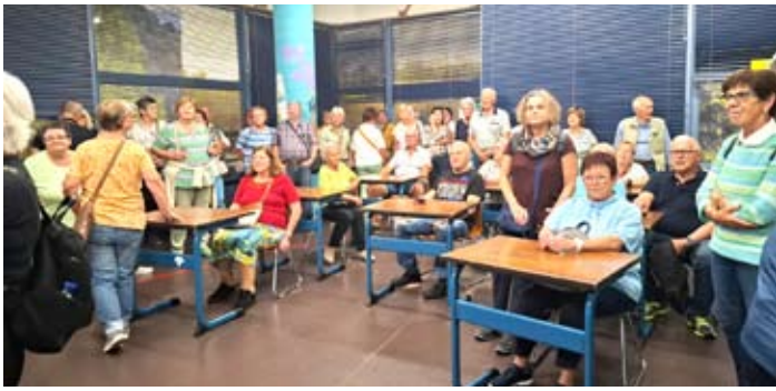
In den Bavaria Filmstudios

konnten wir sogar gemeinsam einen Kriminalfall lösen. Zurück im granitigen Mühlviertel erwarteten uns Musik, Tanz und beste Unterhaltung. Eine stimmungsvolle Laternenwanderung im vorweihnachtlichen Kurpark mit Glühmost sowie unsere traditionelle Weihnachtsfeier