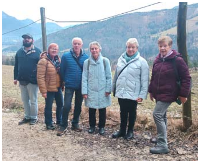
Auf der Kleefeldalm

Unser letzter Ausflug im Jahr 2025 führte uns zur Kleefeldalm und nach St. Wolfgang. Nach dem Mittagessen wanderte ein Teil der Gruppe durch den Tierpark. Das Wetter war sehr angenehm. Anschließend ging unsere Fahrt weiter nach St. Wolfgang zum romantischen Adventort. Wir verbrachten dort ein paar schöne Stunden und erfreuten uns an der vorweihnachtlichen Atmosphäre. Wir konnten viel Kunsthandwerk bewundern und leckere Schmankerl genießen. Am Abend fuhren wir dann nach Hause zurück.