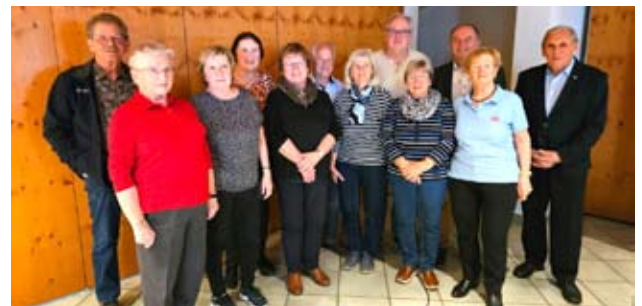
Vorstand der OG Geboltskirchen