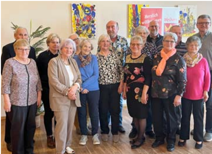
Danke an die scheidenden Funktionäre

Sa., 09.05., 12:00, Muttertagsfeier GH Roitinger