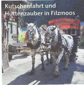
Kutschenfahrt und Hüttenzauber in Filzmoos