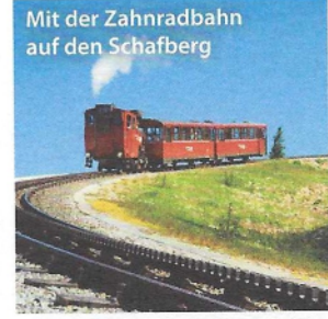
Mit der Zahnradbahn auf den Schafberg