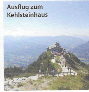
Ausflug zum Kehlsteinhaus