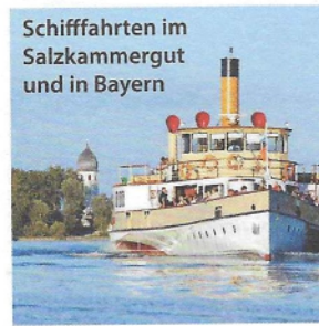
Schifffahrten im Salzkammergut und in Bayern