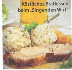
Köstliches Bratlessen beim „Singenden Wirt“