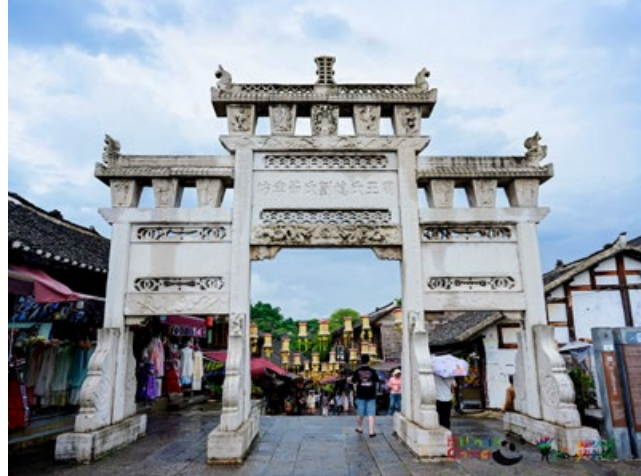
Qingyan ancient town. Die Altstadt in Guizhou wurde vor 620 Jahren während der Ming Dynastie für das Militär gebaut.