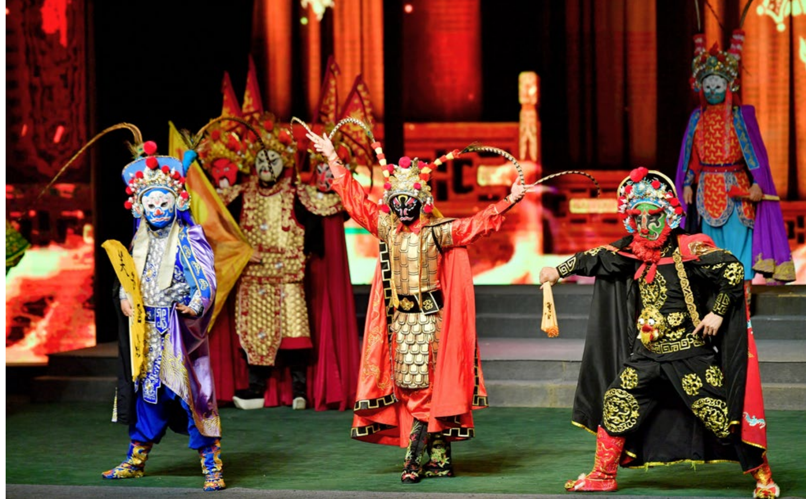
Sichuan-Oper. Farbenprächtige Aufführung und Teil des immateriellen Kulturerbes im Shu Feng Ya Yun Opernhaus.