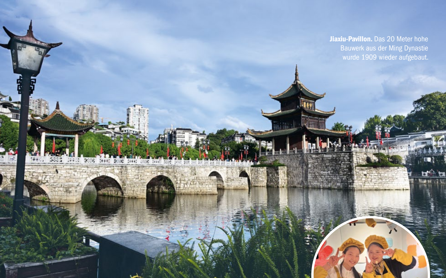
Jiaxiu-Pavillon. Das 20 Meter hohe Bauwerk aus der Ming Dynastie wurde 1909 wieder aufgebaut.

Fast Food. Lächeln in jedem Kleingeschäft.