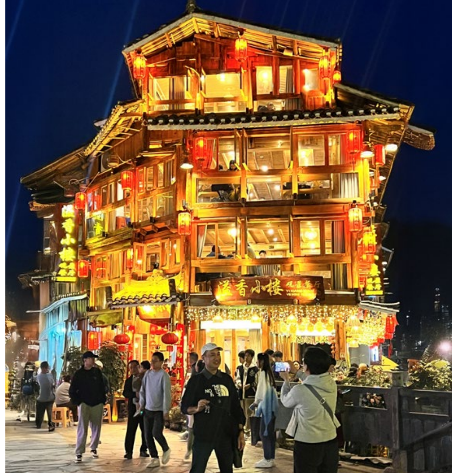
Zhaoxing Dong. In der Nacht leuchtet das Dorf.