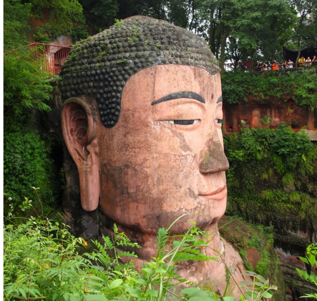
Großer Buddha. In Leshan ist die weltgrößte aus Stein gefertigte Buddha Statue (UNESCO-Weltkulturerbe)