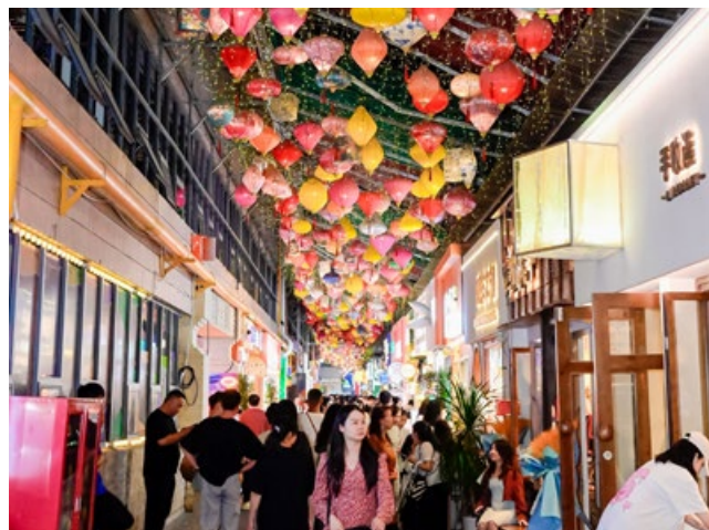
Qingyun Fun Market. Das alte Fabrikareal wurde zum beliebten Markt in Guiyang umwandelt.