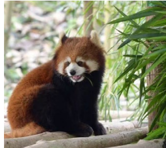
Kleiner oder Roter Panda. In der Chengdu Forschungsbasis gibt es neben den Riesenpandas auch die kleinen rotbraunen Pandas.