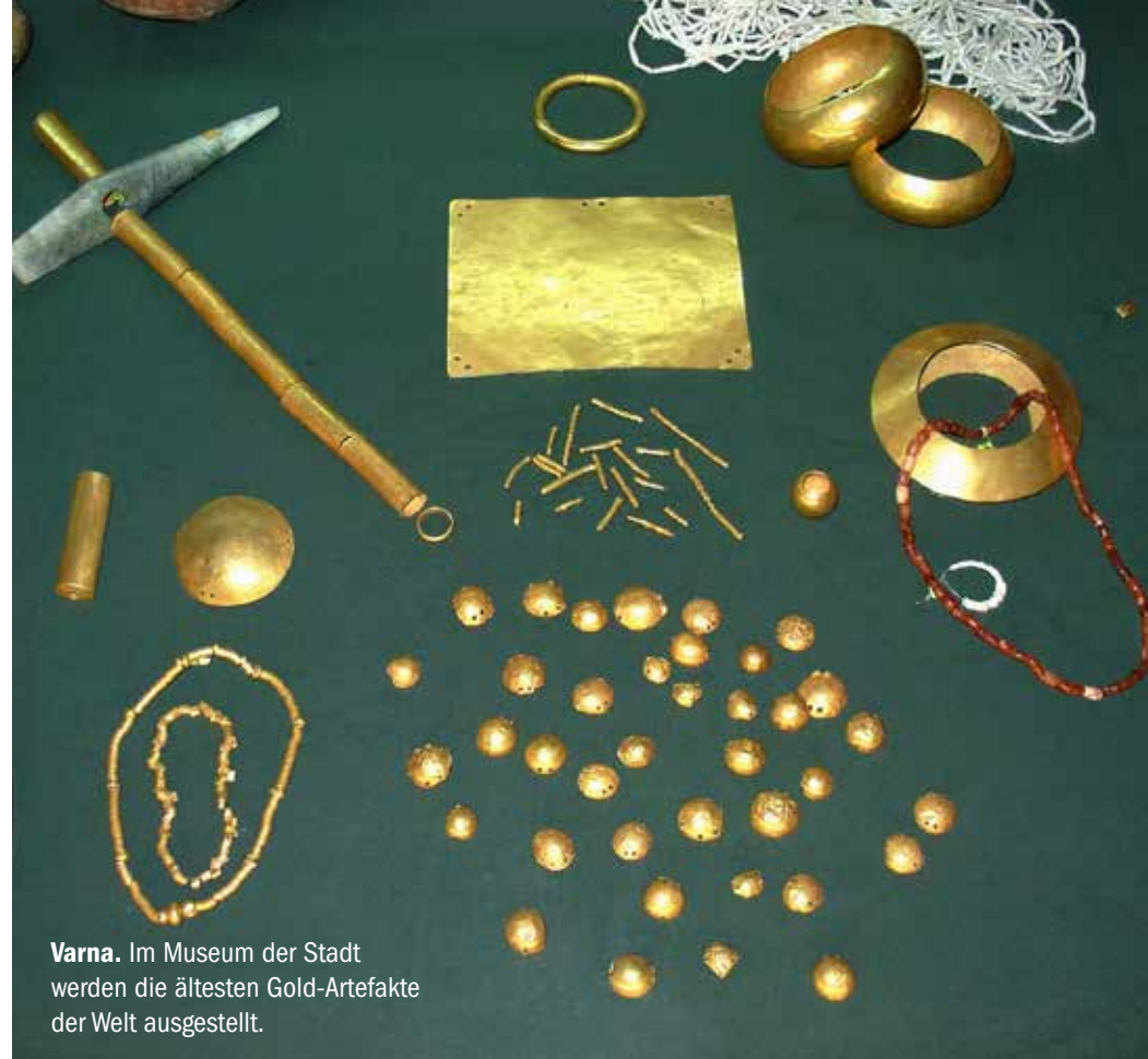
Varna. Im Museum der Stadt werden die ältesten Gold-Artefakte der Welt ausgestellt.