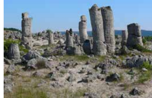
Steinerne Wald. Ein Naturphänomen mit bis zu 10m hohen säulenartigen Gebilden.