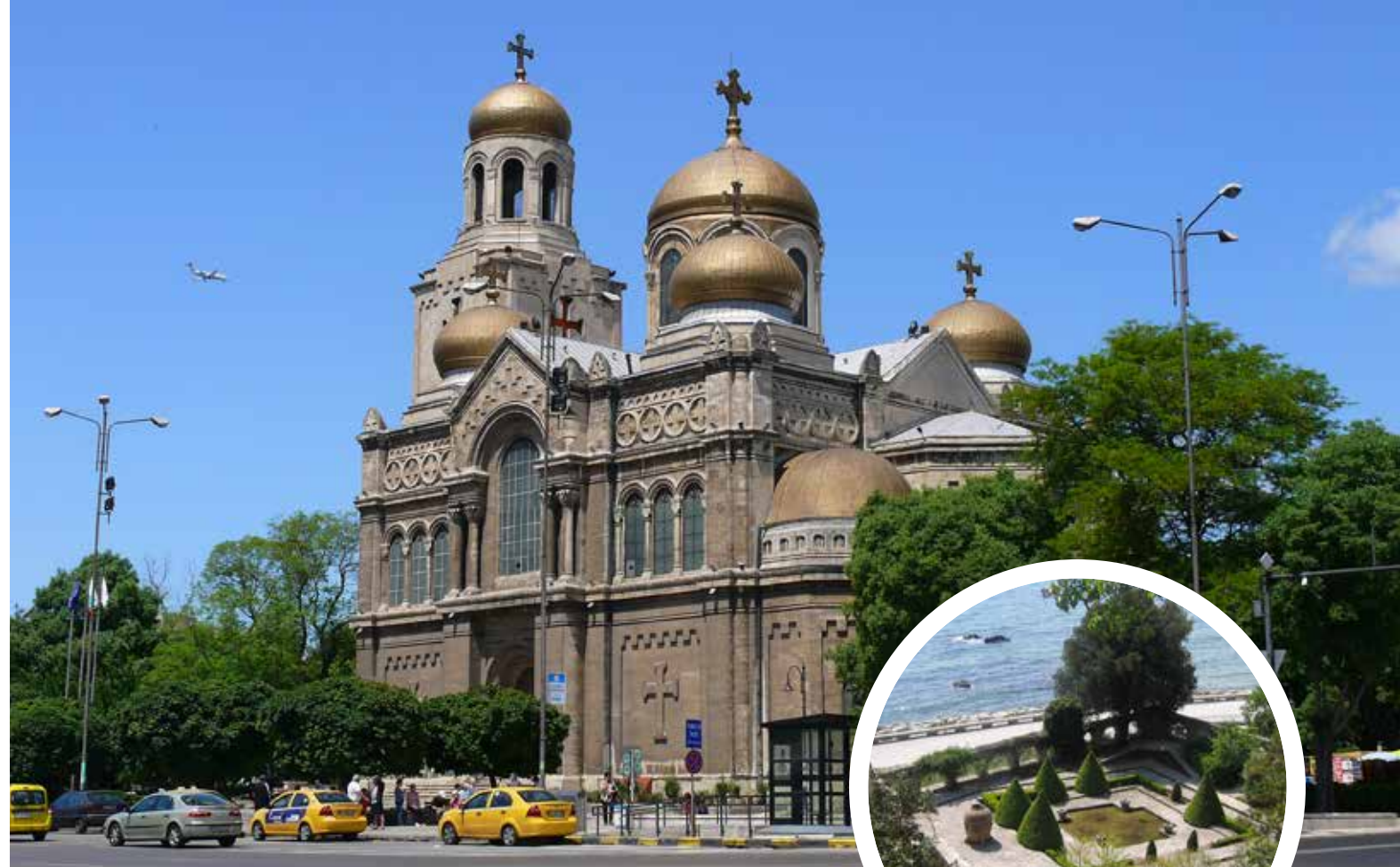
Varna. Die Kathedrale im Stadtzentrum ist Mariä Himmelfahrt gewidmet. Die Dachkonstruktion ist aus Silber- und Goldmaterial veredelt.

den Gänsen und alten Traktoren. Die Krönung des Tages ist die Bewirtung bei einer bulgarischen Familie. Das Mittagessen mit der Familie mit hausgemachten Gerichten wird liebevoll von der Bauernfamilie zubereitet. Frisch gebackenes Bauernbrot, Frischkäse, bulgarischer Blätterteigkuchen, alles aus regionalen Zutaten vorbereitet. Das typische bulgarische Essen wird von Folklore Darbietungen begleitet (mit Mittagessen und ein Getränk).