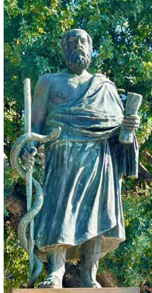
Hippokrates. Heute noch schwören Ärzte den Eid des Hippokrates beim Abschluss ihres Studiums.