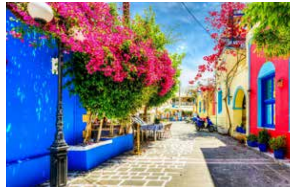
Kos. Altstadt und bunte Gassen.