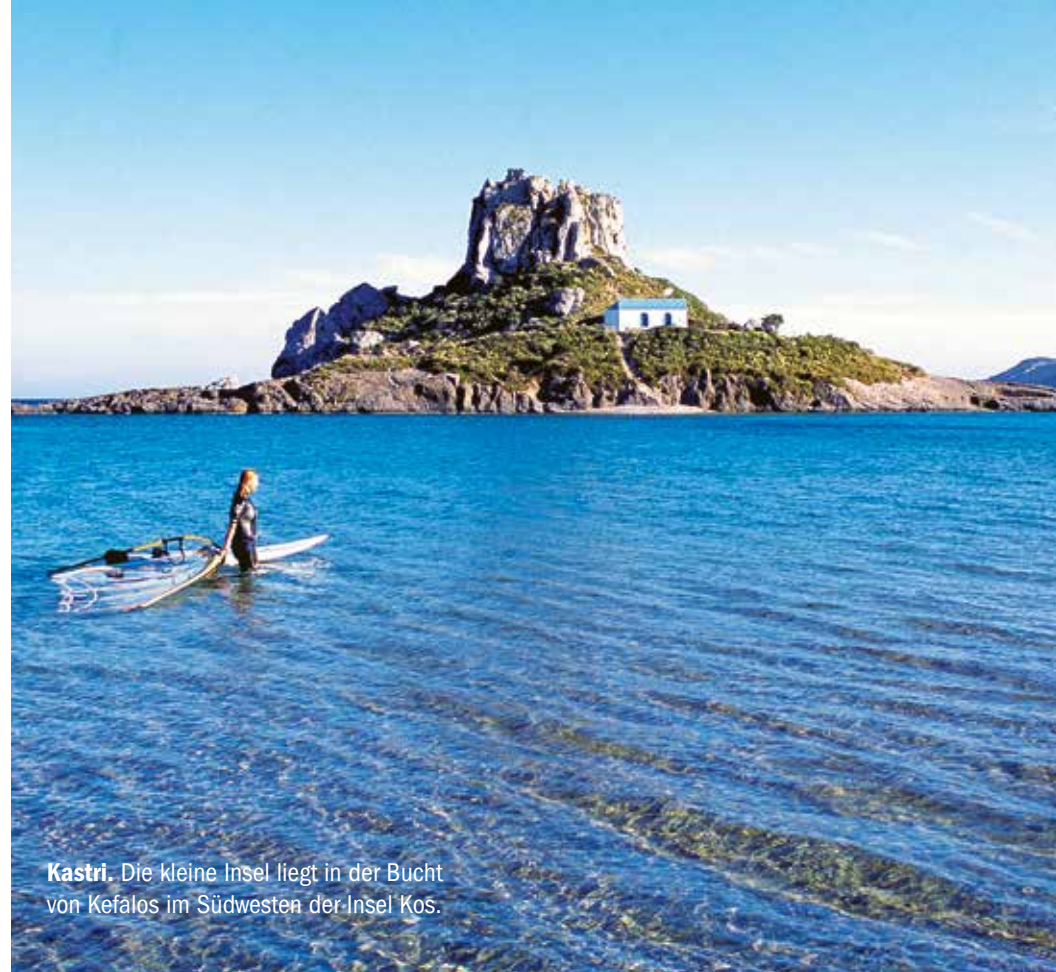
Kastri. Die kleine Insel liegt in der Bucht von Kefalos im Südwesten der Insel Kos.