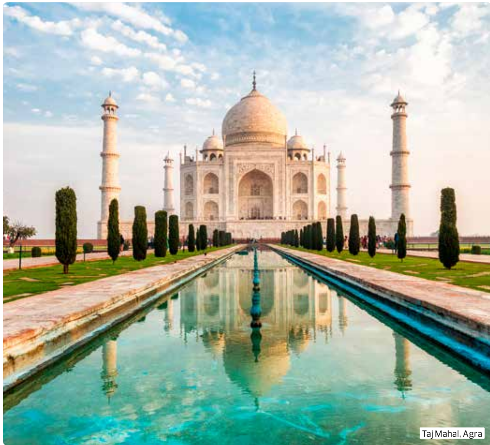
Taj Mahal, Agra