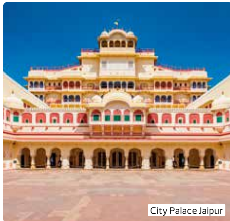
City Palace Jaipur