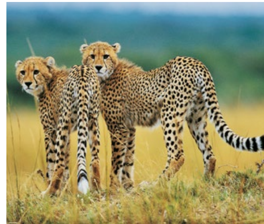
Geparden. Das hauptsächlich in Afrika verbreitete Raubtier gehört zur Familie der Katzen.