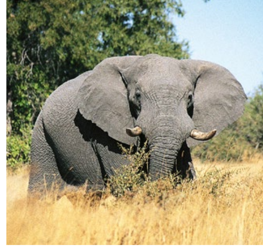
Elefanten. Der Elefant ist das größte an Land lebende Tier. Er wächst sein ganzes Leben lang. Der graue Riese wird auch Dickhäuter genannt.