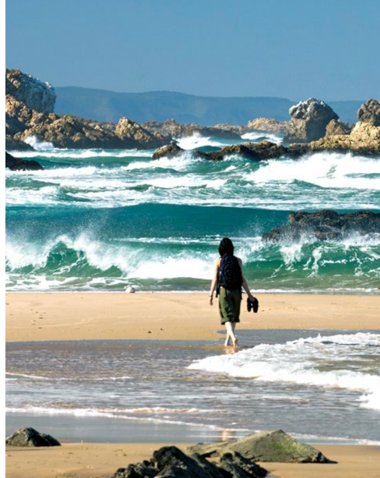
Tsitsikamma Nationalpark. Der Park mit einer Fläche von 29.838 Hektar wurde 1964 eröffnet und erstreckt sich über fast 100 Kilometer entlang der Küste zwischen Kap St. Francis und Plettenberg Bay.