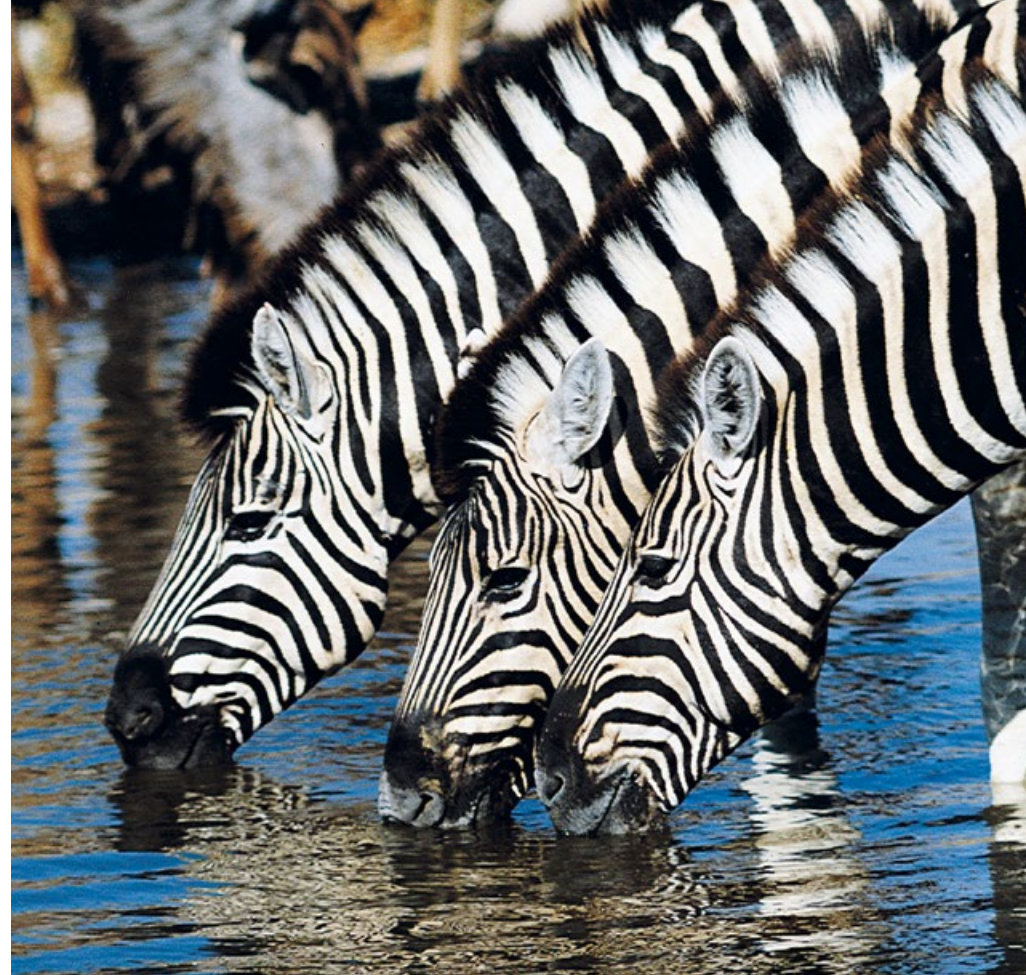
Zebras. Das schwarzweiße Muster gilt als Fingerabdruck der Herdetiere.