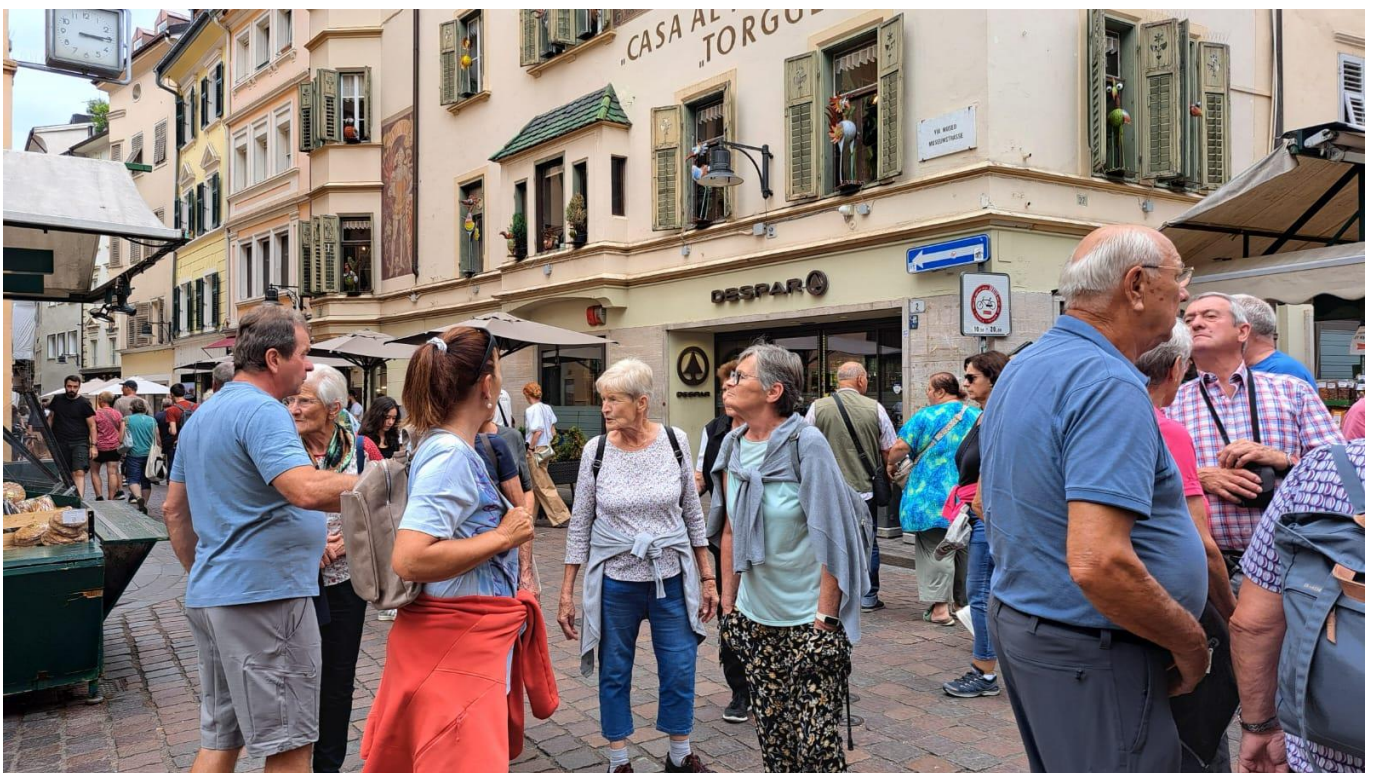
Stadtbummel in Bozen