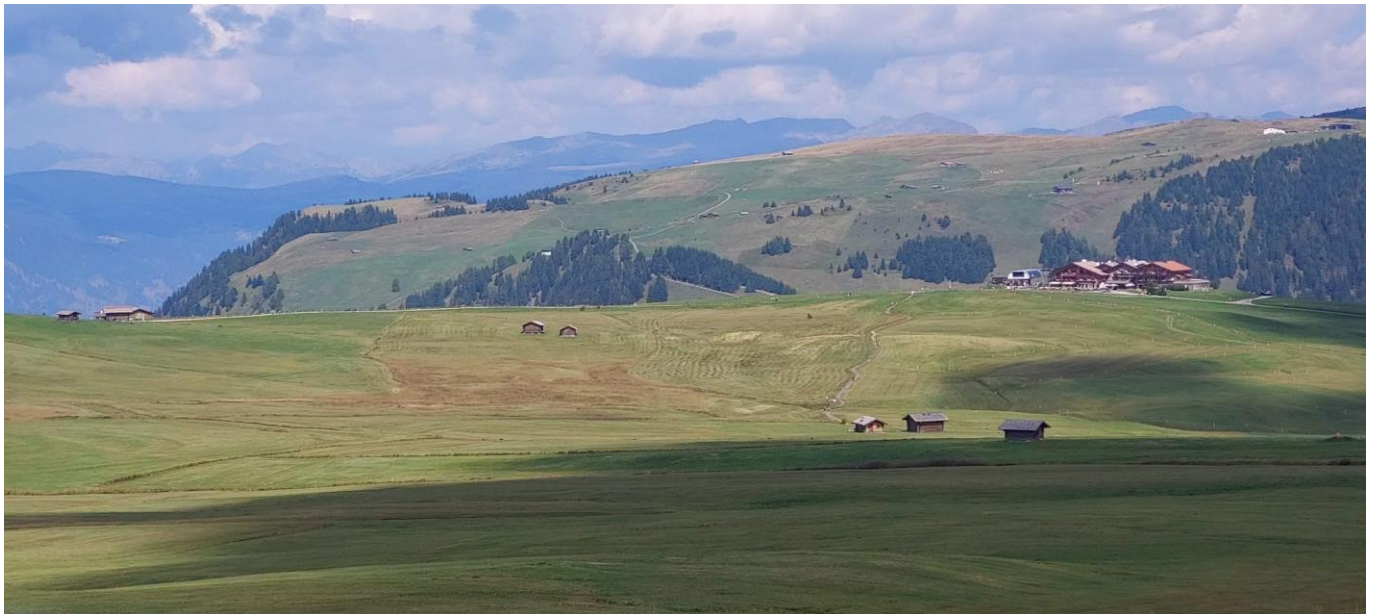
Die Seiseralm ist mit 56km 2 die größte Hochalm Europas