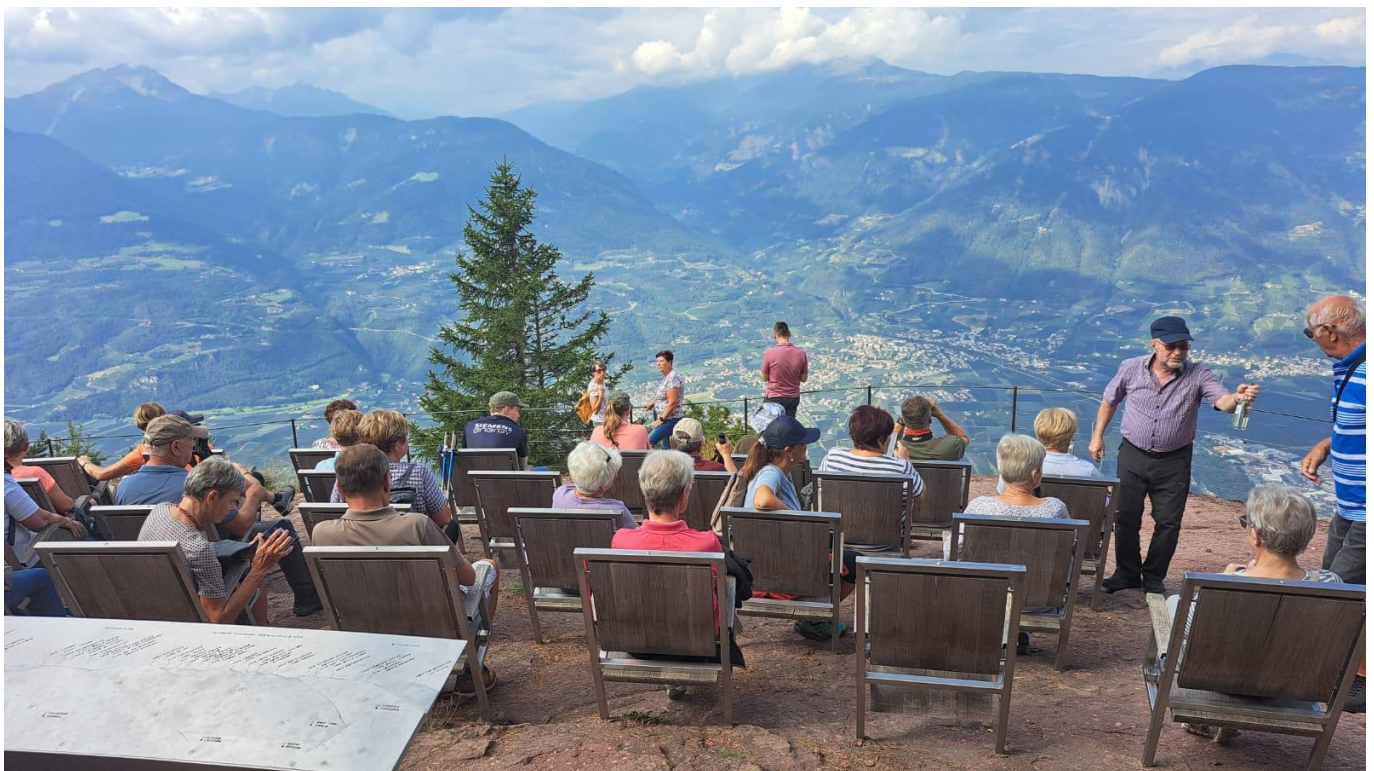
Das große Freiluftkino zwischen Himmel und Erde – Cinemascope ist NICHTS dagegen