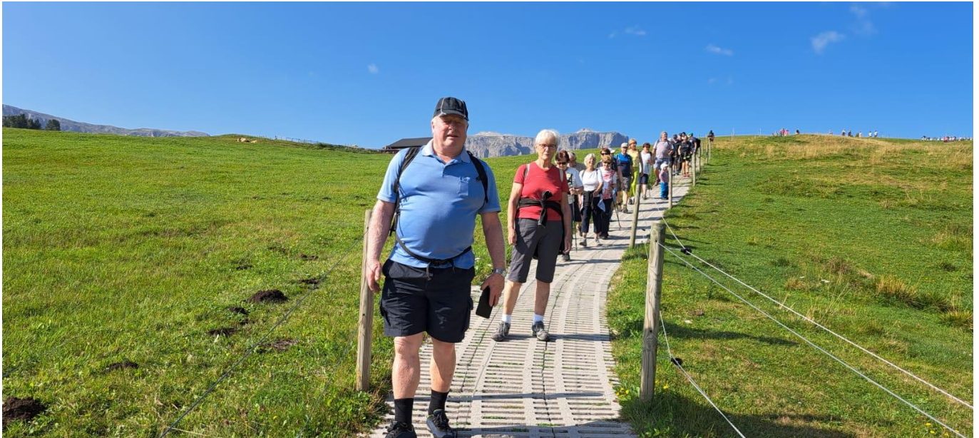
Unsere Wanderer auf der Seiser Alm