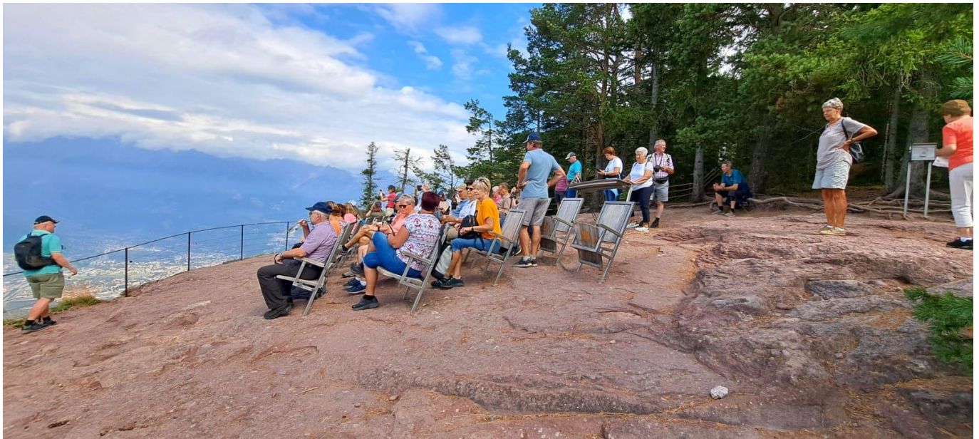
Zu Besuch im Freiluftkino...