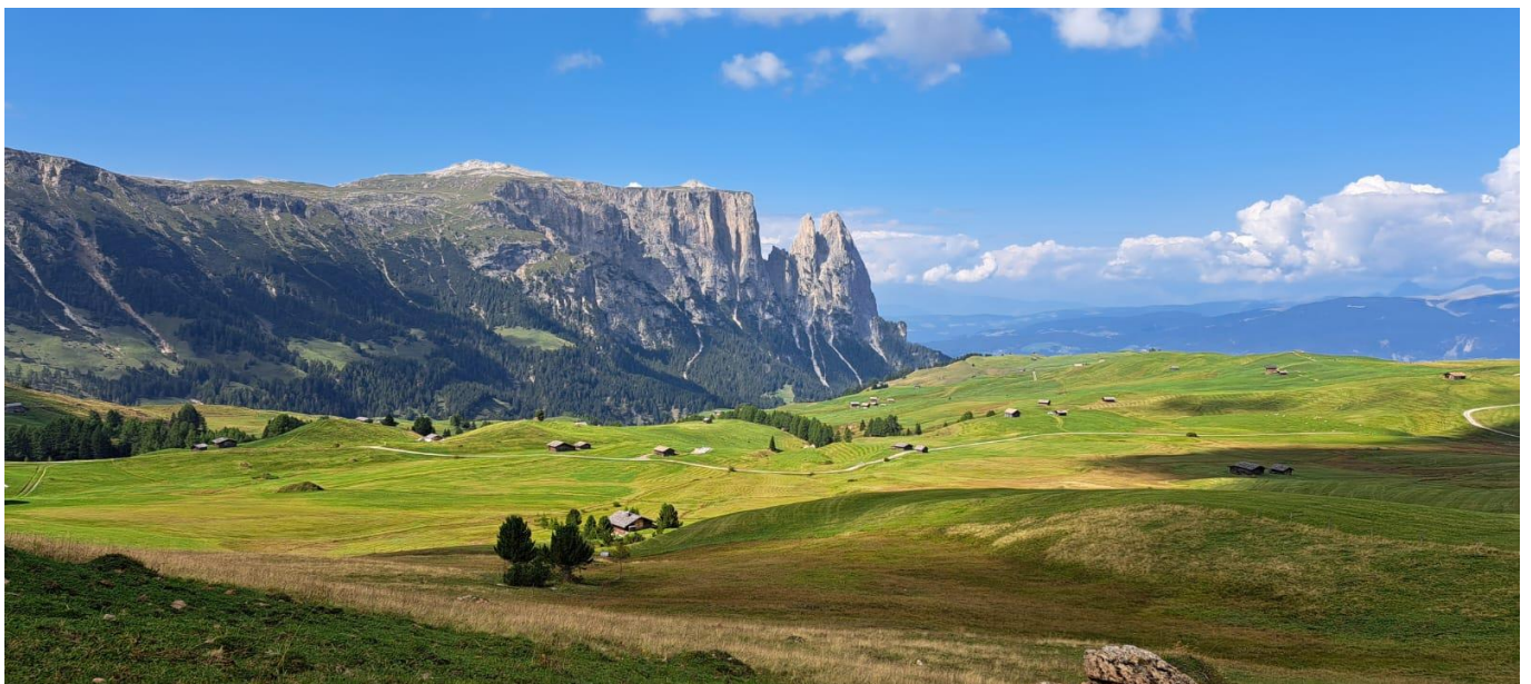
Seiseralmpanoramablick auf Schlern und Rosengarten