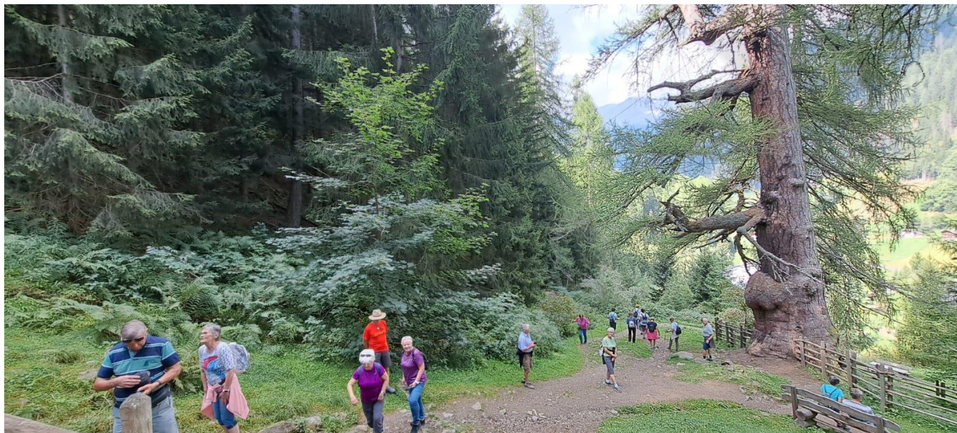
Besichtigung der Urlärchen