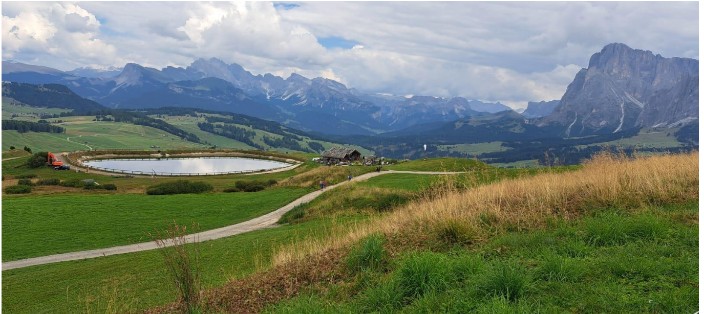
Speicherteich mit Edelweißhütte