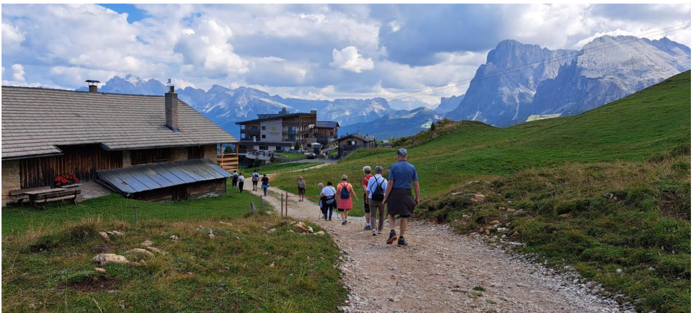
Unser Wanderziel das Hotel Goldknopf inmitten der Seiser Alm