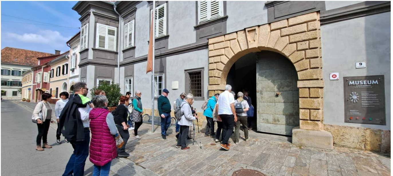
Auf geht's ins Stadtmuseum