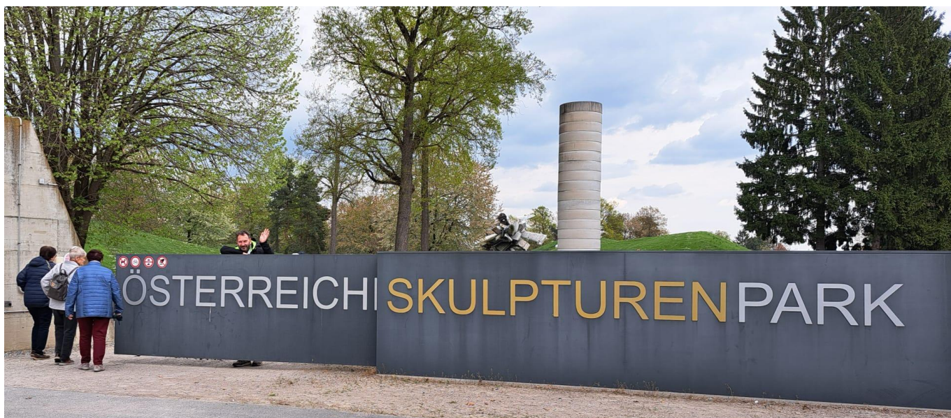
Der zweite Programmpunkt, der Österreichische Skulpturenpark bei Unterpremstätten, direkt beim Schwarzl-Freizeitzentrum