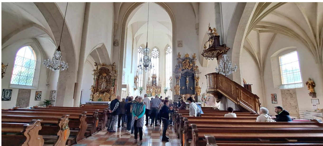
Das Innere der Stadtpfarrkirche