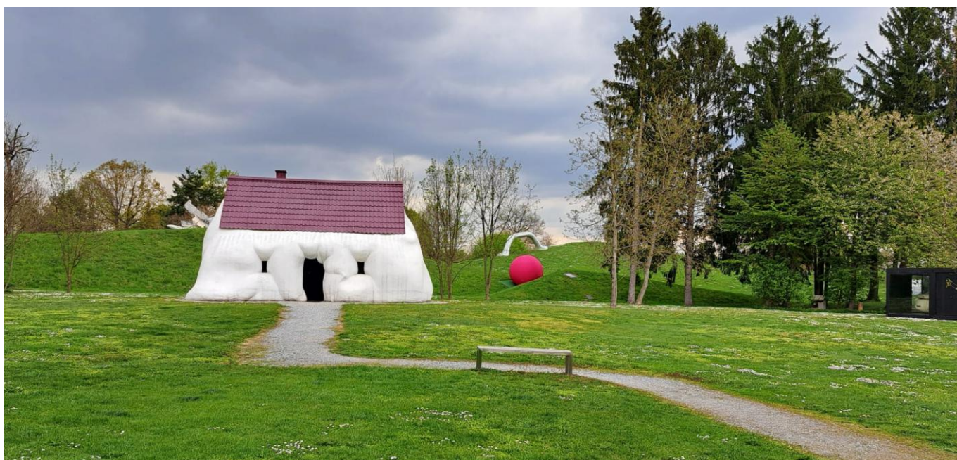
Das Fat House von Erwin Wurm – eines der bekanntesten Objekte im Park (rechts im Bild ist angeschnitten eine Garage mit dem Fat Car zu sehen (übrigens ein Alfa Romeo 155)).