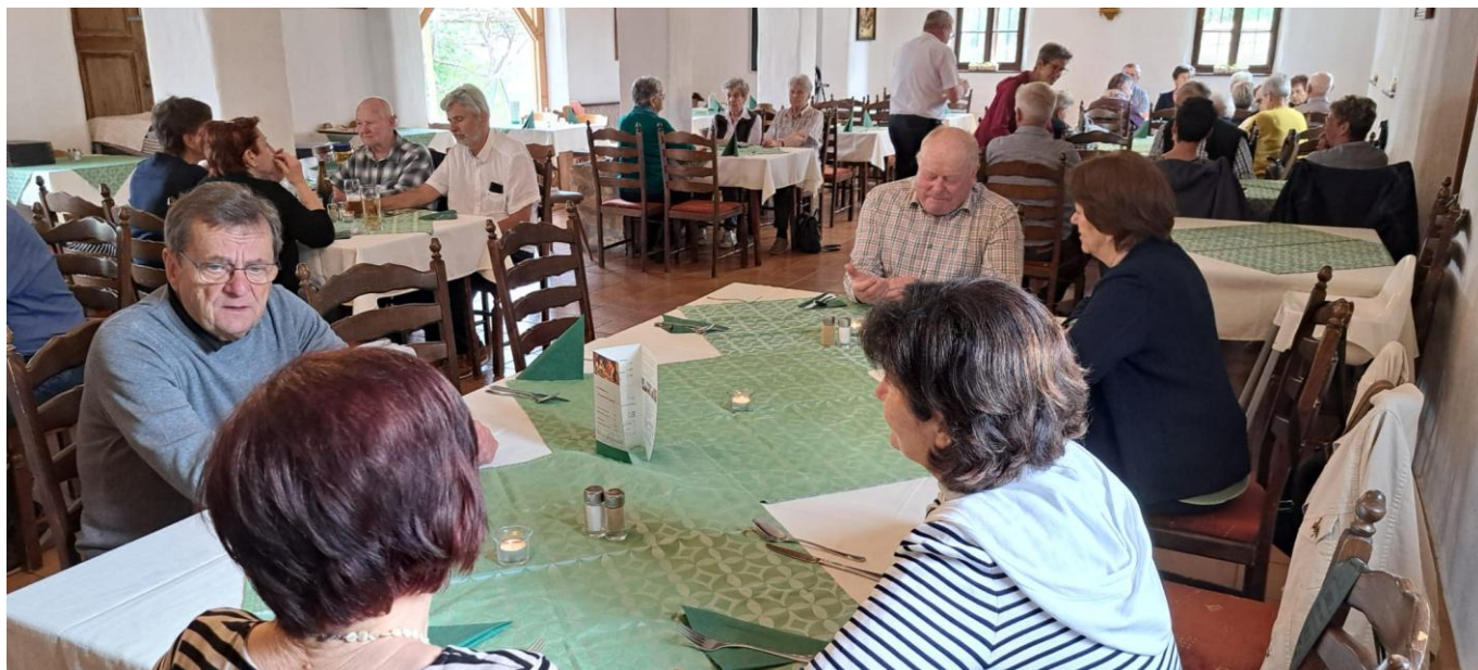
Mittagessen im Brunnenstadl