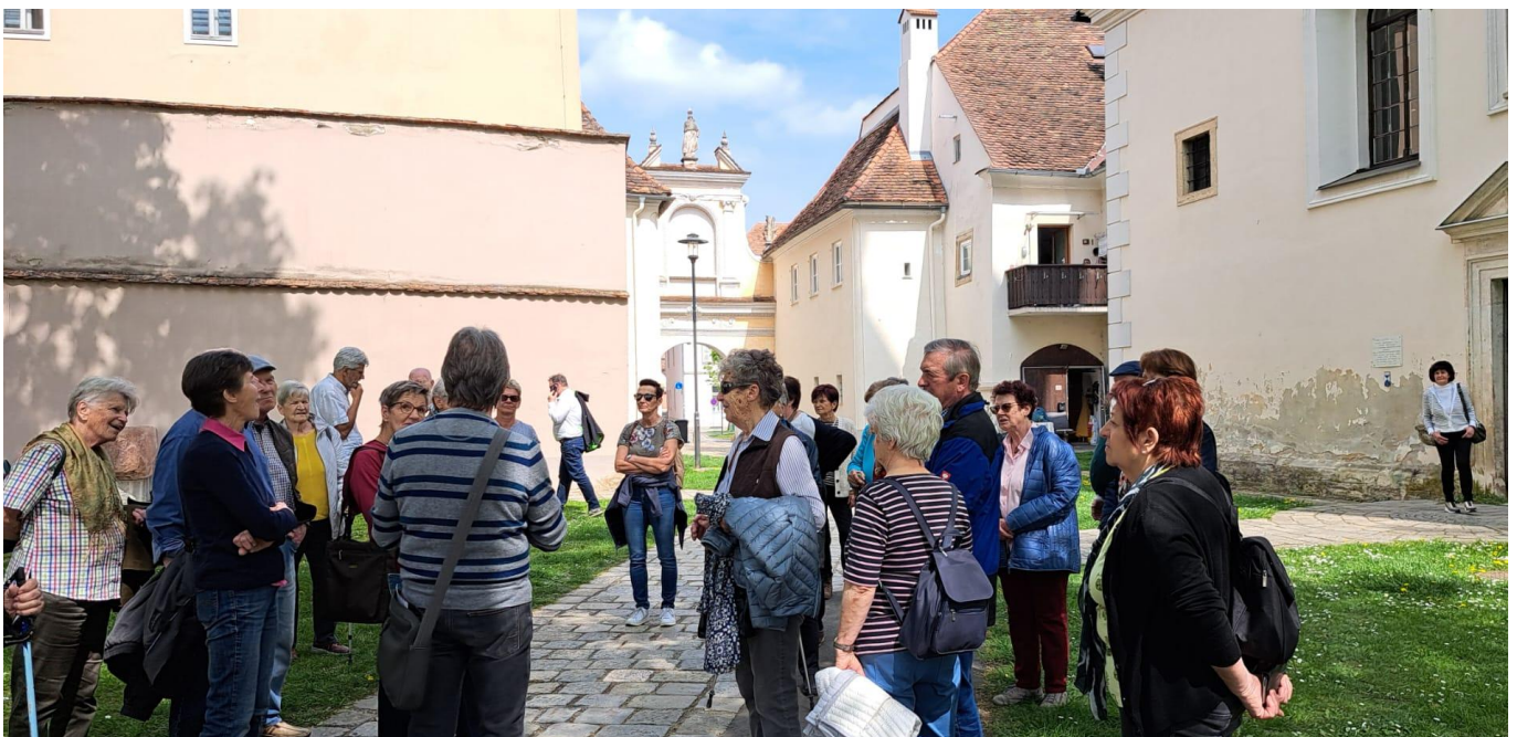
Auf dem Frauenplatz