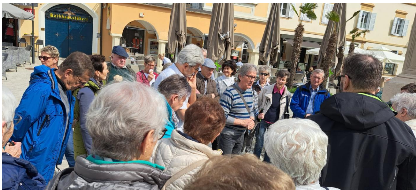
Mit einem Stadtführer tauchen wir tief in die Geschichte Radkersburgs ein