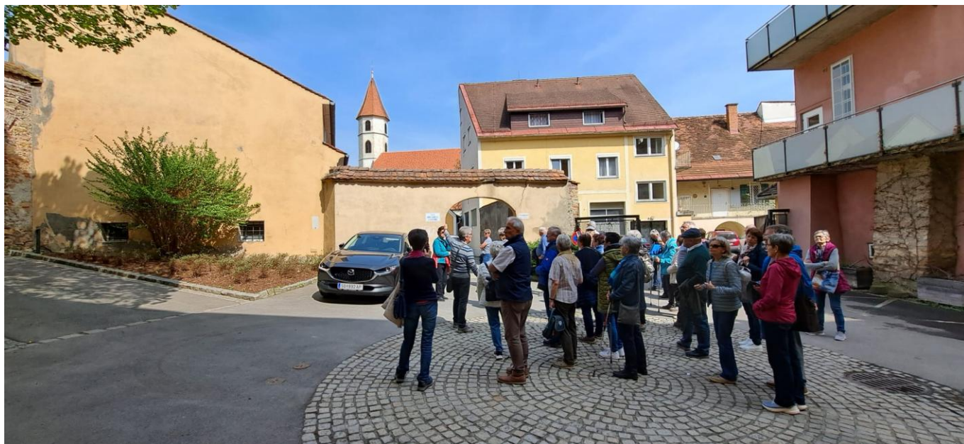
Auf dem Weg zur Stadtpfarrkirche