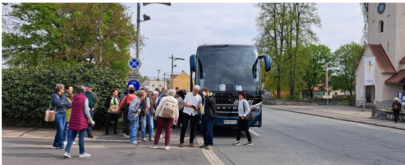
Ankunft in Bad Radkersburg