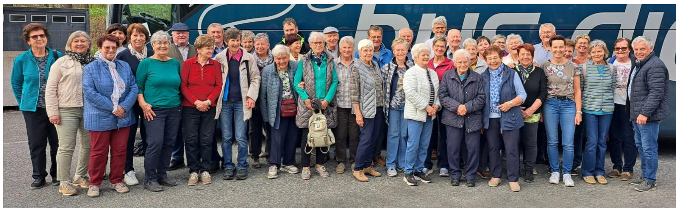
Die Teilnehmenden unserer Frühlingsfahrt