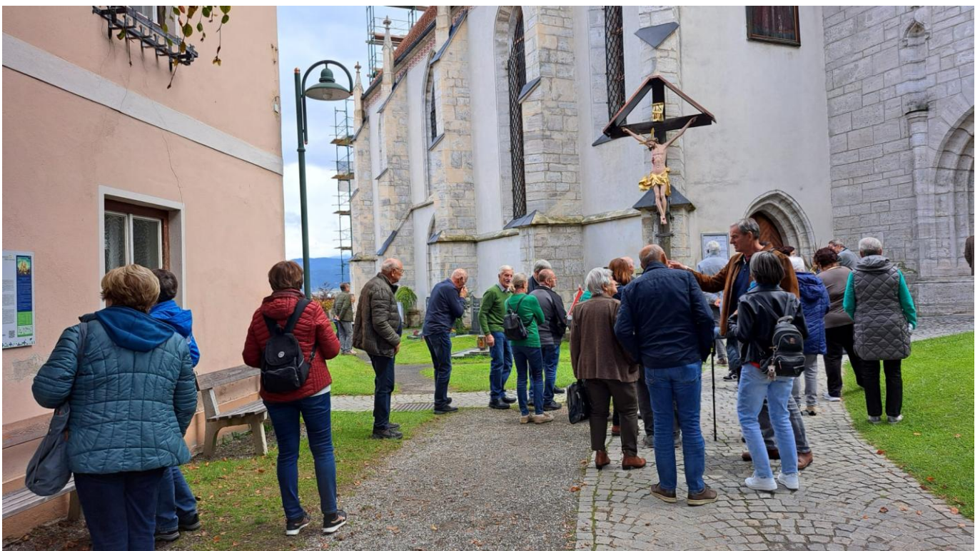
Auf dem Weg zur Kirchenführung