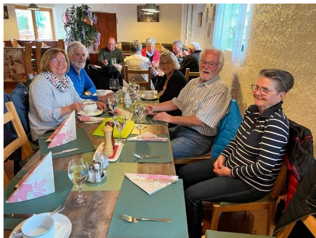
Ein Päuschen in Ehren...