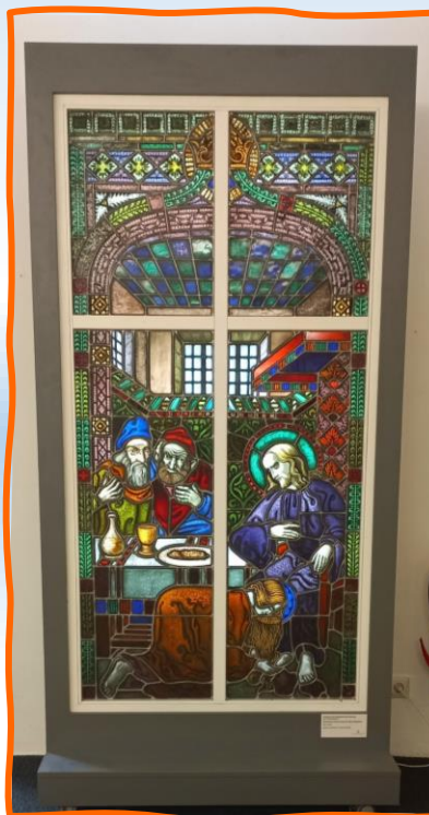
Erzählung über die Glasmalerei