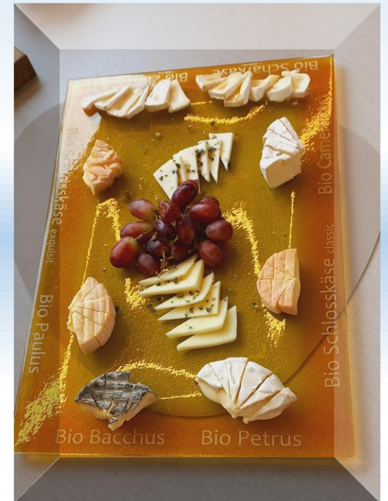
Alles Käse oder was?....