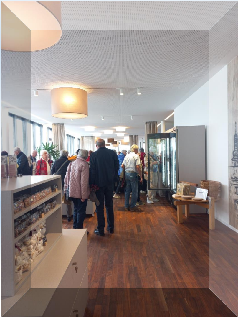
Im Panorama-Cafe und Klosterladen