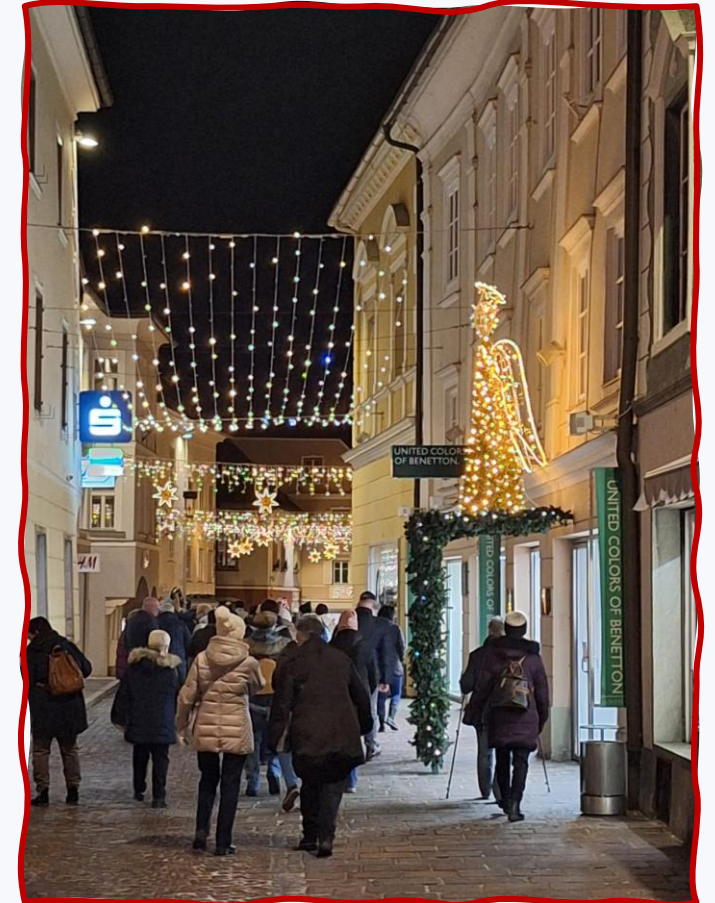
Es geht zum Bus