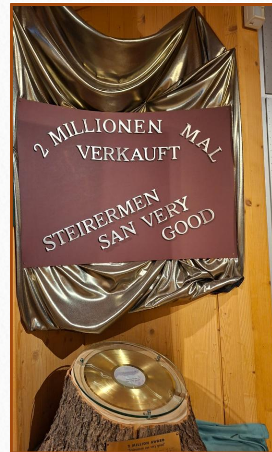
50 Jahre Musikgeschichte - unglaublich