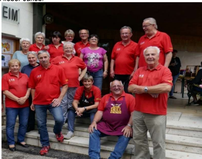
Unsere fleißigen Arbeitsbienen bei unseren Veranstaltungen.