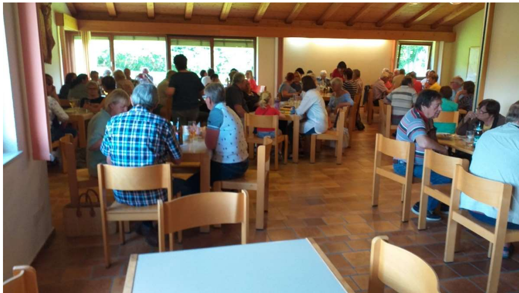
Grillnachmittag 2024: Auch heuer wieder das Highlight unserer Veranstaltungen so konnten wir wieder einen Rekordbesuch verzeichnen wir waren auch diesmal wieder am Abend ausverkauft.