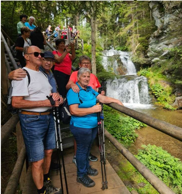
und die Graggerschlucht