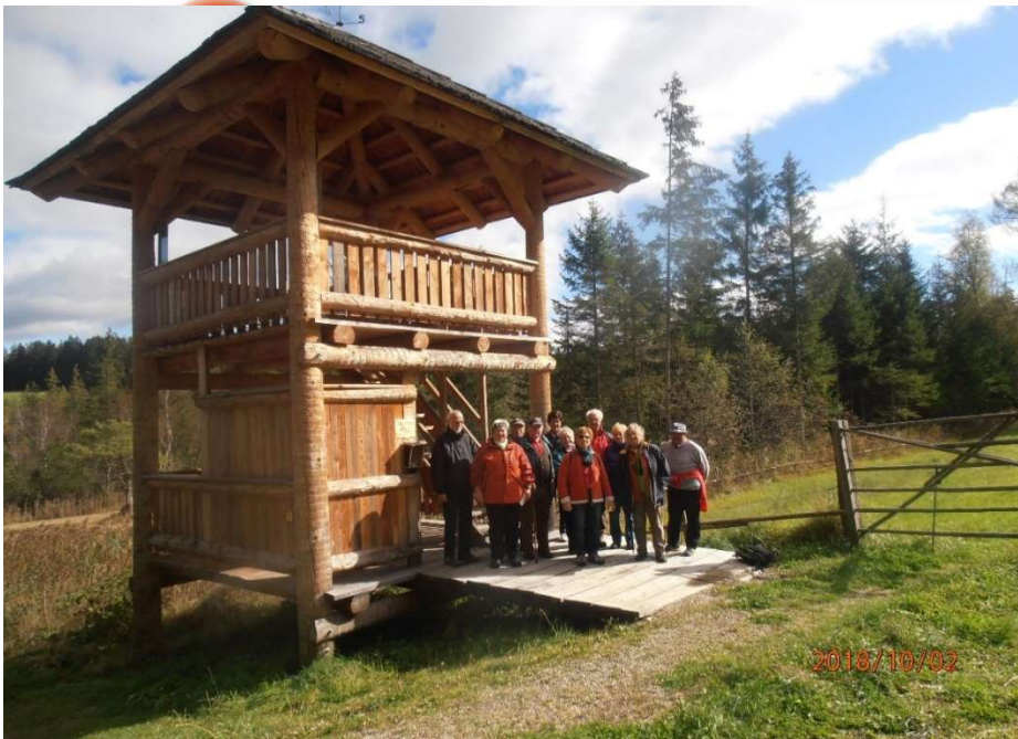
Auch 2025 wieder im Programm die Wanderung ins Dürnberger Moor