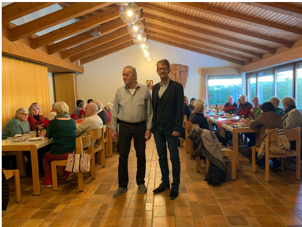
Über 40 Teilnehmer bei unserem letzten Infonachmittag 2024

Sollten sich im Jahresprogramm irgendwelche Fehler eingeschlichen haben, bitte ich, dies zu entschuldigen. Ich hab' sie nicht absichtlich gemacht. Ein herzliches Dankeschön an alle Funktionäre und Mitarbeiter, die für einen reibungslosen Ablauf unserer Veranstaltungen sorgten und mich, wo es nur ging, unterstützten! Auch allen Gönnern und Sponsoren ein herzliches Dankeschön für die freundliche Unterstützung