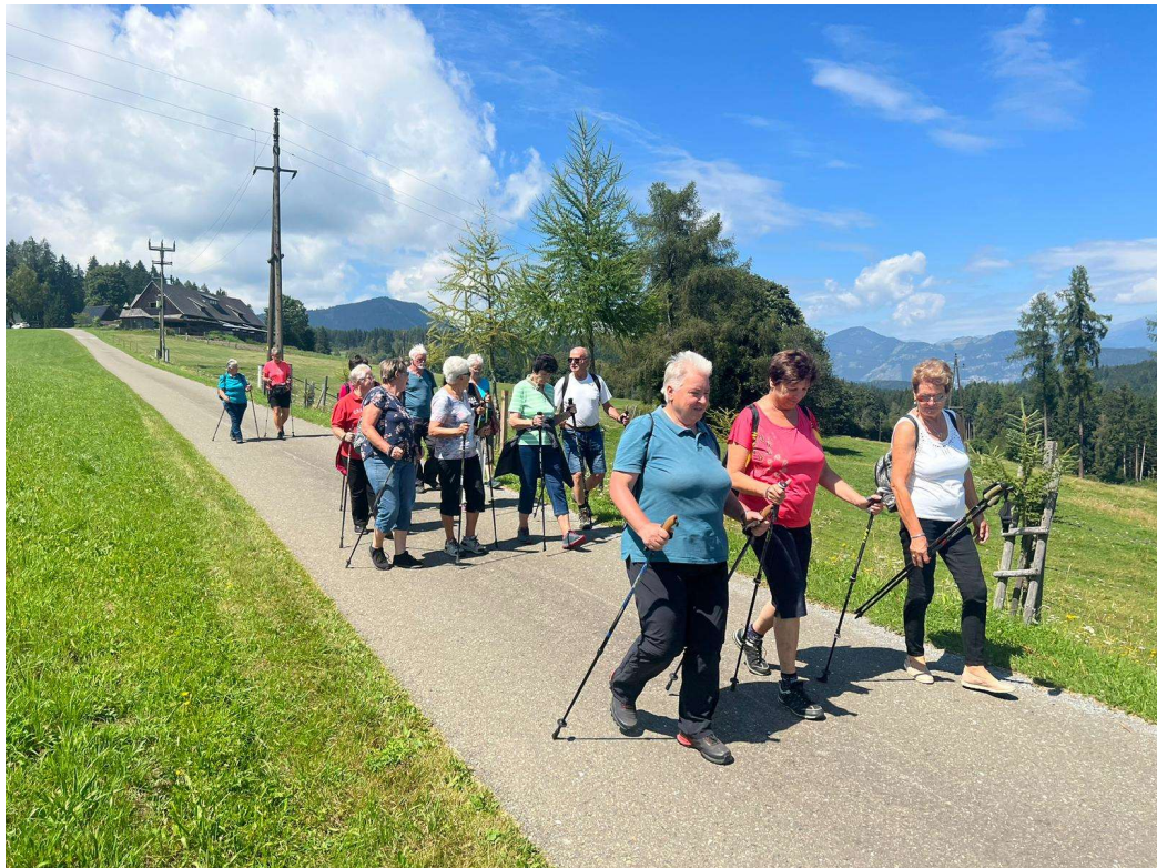
Sowie rund um Neumarkt