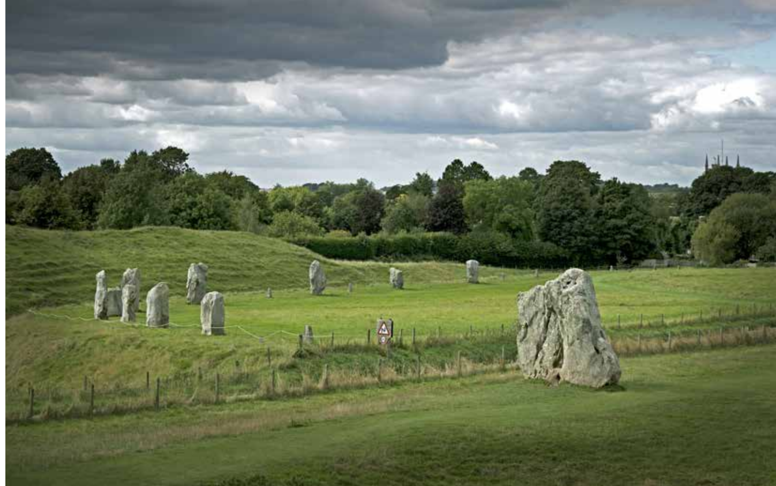
Avebury. Der Steinkreis gehört zum UNESCO-Weltkulturerbe.