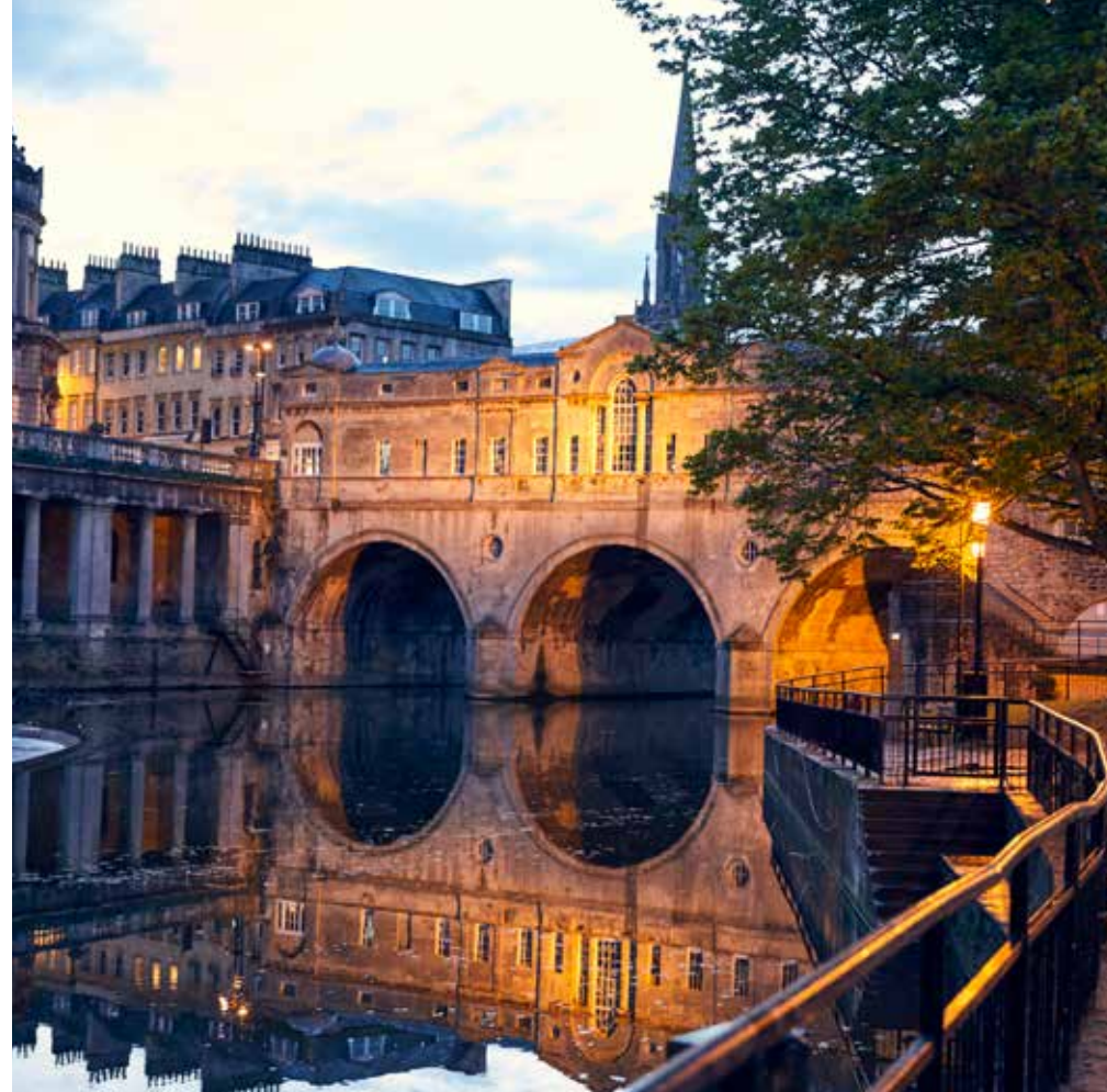
Bath. Die historische Kurstadt kommt oft in Jane Austen-Romanen vor.