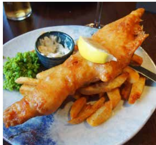
Fisch & Chips. Traditionelles englisches Gericht.

torianischen Zeit, umgeben von wunderschönen Gärten (Eintritt nicht inklusive, siehe Eintrittspaket). Nächtigung in Torquay im Hotel Hampton by Hilton Torquay (oder gleichwertig).