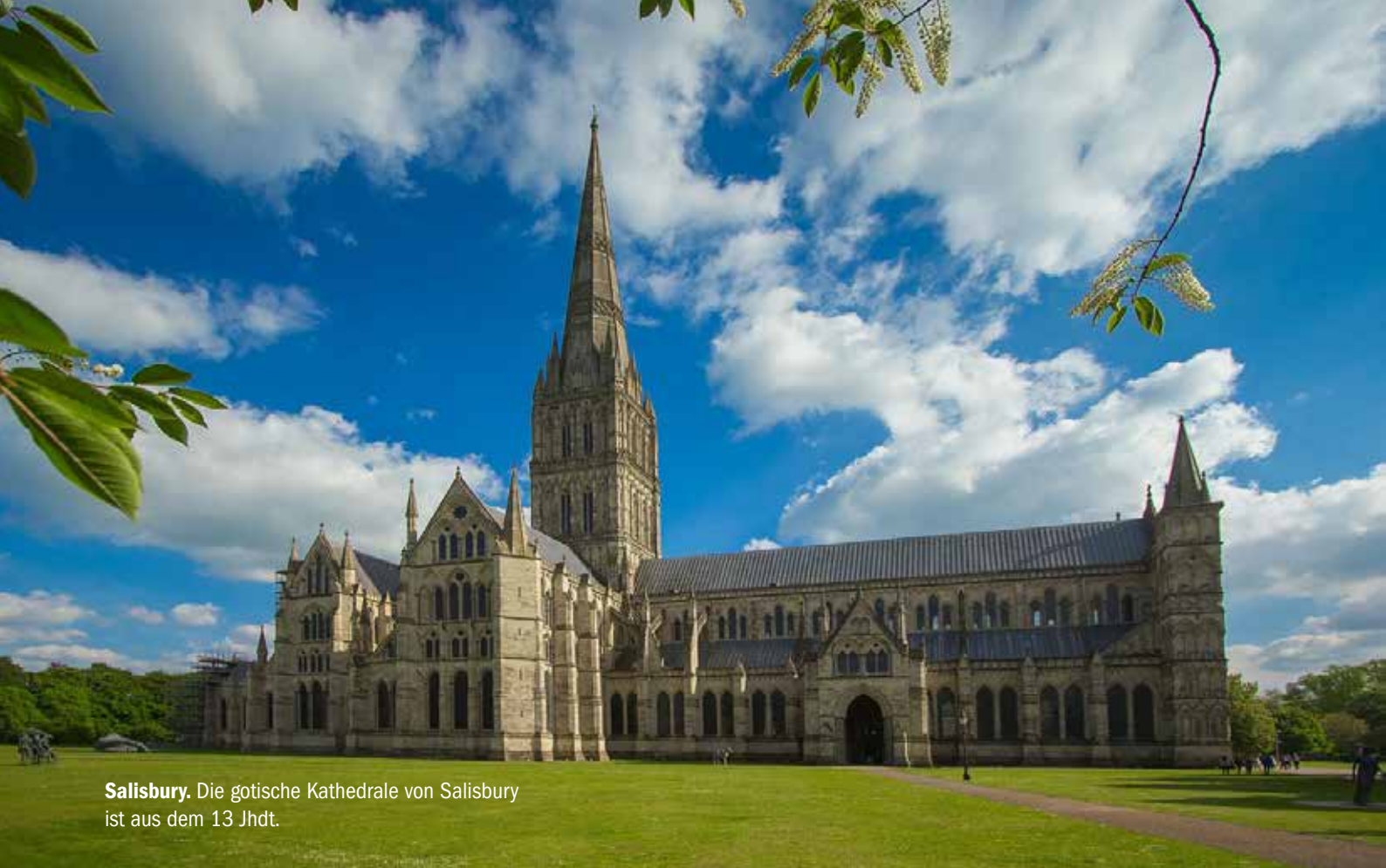
Salisbury. Die gotische Kathedrale von Salisbury ist aus dem 13 Jhdt.