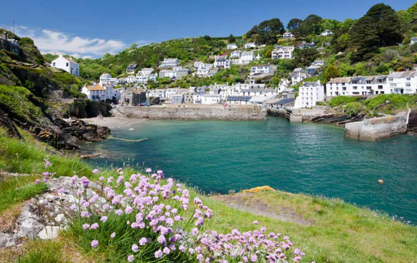
Polperro. Das idyllische Fischerdorf in Cornwall.