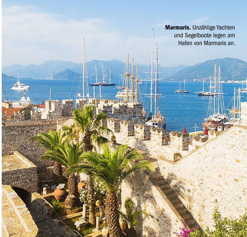
Marmaris. Unzählige Yachten und Segelboote legen am Hafen von Marmaris an.

wo die alte Burg von Marmaris und der Yachthafen aufeinandertreffen, bewahrt weiterhin noch seinen alten Charme. Der Yachthafen ist einer der größten und modernsten Häfen im Süden der Ägäis. Dem Seeverkehr kommt hier eine wichtige Bedeutung zu. Hier legen viele luxuriöse Yachten an, es gibt einen regelrechten Verkehr mit den griechischen Inseln. Ein großer überdeckter Bazaar bietet Gewürze, den berühmten Kiefernhonig, Nüsse, diverse Mitbringsel, ein rundum facettenreiches Angebot an. Der alte historische Teil ist ein Geheimtipp, denn in jedem Winkel öffnet sich eine neue Gasse. Die typischen Häuser reihen sich entlang der Festung, verkleidet in weiß mit grünen und blauen Türen. Eine Farbenpracht aus Blumen, die aus den kleinen Fenstern herausragen, offenbart sich dem Auge des Betrachters. Entdecken Sie während Ihres Aufenthaltes auch die Vielfalt und den Reichtum der türkischen Küche, die durch die Vermischung verschiedener Kulturen als eine der traditionellsten und bekannteste Küchen gilt.