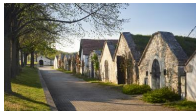
PHOTO_BY_HISTORISCHE KELLERGASSE - © BURGENLAND TOURISMUS GMBH, PETER_PODPERA

In einem alten Weingut werden wir zu einer 5er Weinprobe mit Grammel-pogatscherl erwartet.