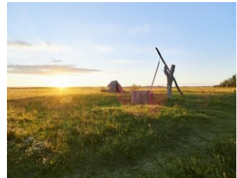
PHOTO_BY_ZIEHBRUNNEN BEI DER LANGEN LACKE - © BURGENLAND TOURISMUS GMBH, PETER PODPERA

Gefolgt von einer Fahrt in den Illmitzer Seewinkel. Diese einzigartige Naturlandschaft mit Salzlacken, Tümpeln, Trockenwiesen und weitem Schilfbestand gilt als eines der wichtigsten Vogelreservate Europas. Mit einem Planwagen unternehmen wir eine kleine Rundfahrt durch das herrliche Naturschutzgebiet.