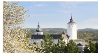
PHOTO_BURG FORCHTENSTEIN

Sie beherbergt die schönsten Exponate Der Esterházy Schatzkammer. Bei einer